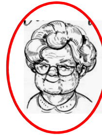
Presidente / Vorsitzender