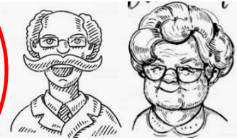
Scrutatori / Stimmzähler