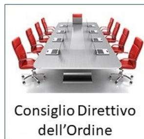
Consiglio Direttivo dell'Ordine